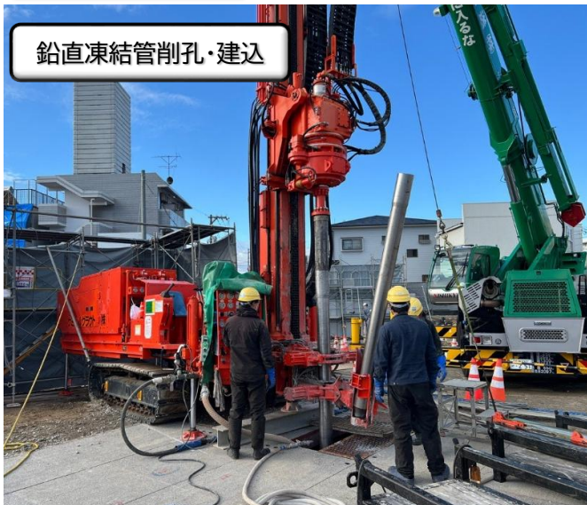
使用機械 (ソニックドリル)